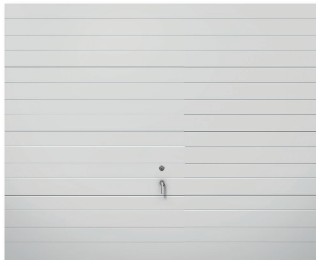
1928 SOM STANDARD (VIT MED HANDTAG)

Alla modeller och aktuella priser hittar du på webben.