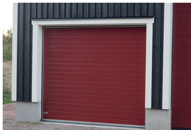
1928 I RÖD VERSION